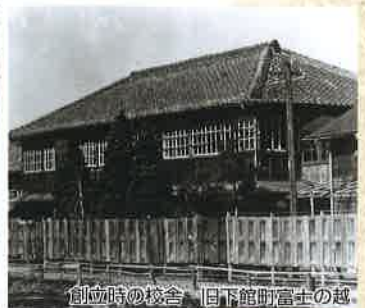
創立時の校舎 旧下館町富士の越